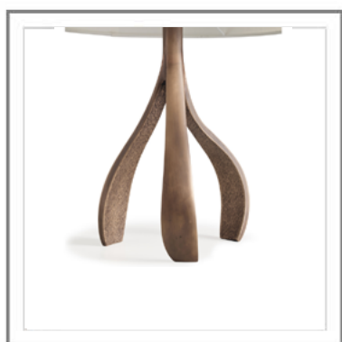
DALIA _ Dettaglio struttura in finitura Bronzata, rifinita a mano. | Close-up: structure in Bronzed finish refined by hand.