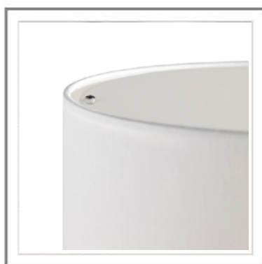
DALIA _ Vista dall'alto, paralume in lino con diffusore in vetro bianco. | Top view: Lampshade in linen, white color. Diffuser in white glass.