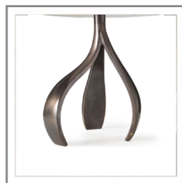
DALIA _ Dettaglio struttura in finitura Patinata, rifinita a mano. | Close-up: structure in Black Patina finish refined by hand.