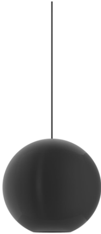
BORA XL SUSPENSION 15W SWITCH 2700-3200-4000K EMPOTRAR/SUPERFI NEGRO