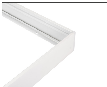
032970 Набор SX6060T White

Белая рамка для накладной установки панелей