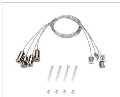
029583(1) Набор SPX-T4 для панелей 600×600

Белая рамка для накладной установки панелей