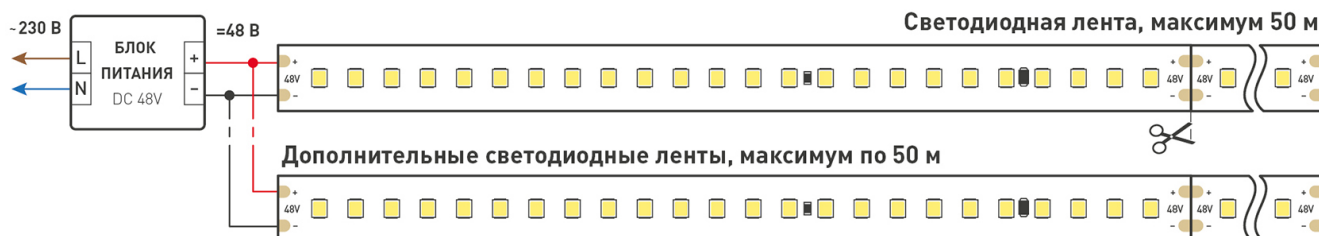
Схема подключения нескольких светодиодных лент с одной стороны.

Максимальная длина подключения ленты – 50 м (1 катушка).