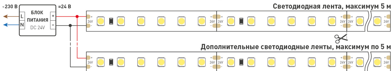
Схема 1. Подключение нескольких светодиодных лент с одной стороны.

Максимальная длина подключения ленты – 5 м (1 катушка).