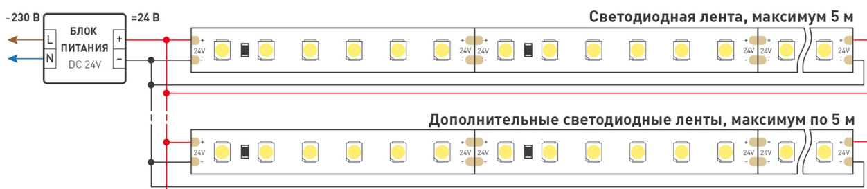
Схема 2. Подключение нескольких светодиодных лент с двух сторон.

Рекомендуется использовать для обеспечения равномерного свечения ленты по всей длине.