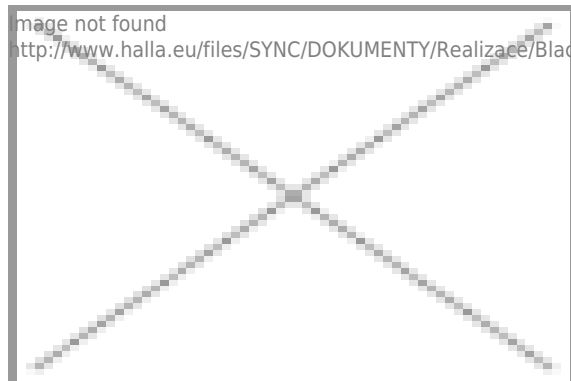
image not found http://www.halla.eu/files/SYNC/DOKUMENTY/Realizace/Black Butic